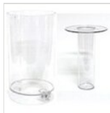
Saft- und Eisbehälter rund (4l)