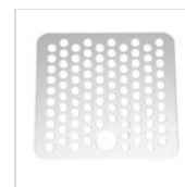
Quadratisches Tropfgitter 14 x 14 cm in Edelstahl GRI-QUADRA

Aus produktionstechnischen Gründen sind die genannten Informationen unverbindlich und können ohne vorherige Ankündigung geändert werden. Verkaufsbedingungen sind auf Anfrage erhältlich. Da es sich bei dem Material Holz um ein Naturprodukt handelt, sind die abgebildeten Farben nur Richtwerte. Eventuelle Farb- und Maserungsunterschiede gegenüber Mustern und früheren Lieferungen sind kein Reklamationsgrund. Alle Teile und Materialien mit direktem Kontakt mit Lebensmitteln sind nach den gesetzlichen Vorschriften für den Lebensmittelkontakt geprüft und zugelassen. Alle Rechte vorbehalten - ©Ze Pé.