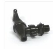
Standardzapfhahn schwarz RUB-P