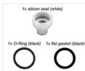
Dichtungen für alle Zapfhähne außer RUB-ECO GUARNIZIONI SET