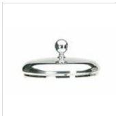
Runder Deckel in Inox für Saft- /Müslispender (7l) mit Halteknopf COPERCHIO 20