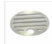
Tropfgitter Ø 11,9 cm in Edelstahl GRI1