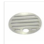
Tropfgitter Ø 11,9 cm in Edelstahl GRI1