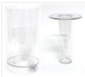
Saft- und Eisbehälter rund (7l) CONT-ICE 1 (7L)