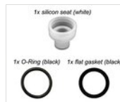
Dichtungen für alle Zapfhähne außer RUB-ECO GUARNIZIONI SET