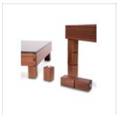
NATURE Set aus 12 Füßchen 15K16910

Aus produktionstechnischen Gründen sind die genannten Informationen unverbindlich und können ohne vorherige Ankündigung geändert werden. Verkaufsbedingungen sind auf Anfrage erhältlich. Da es sich bei dem Material Holz um ein Naturprodukt handelt, sind die abgebildeten Farben nur Richtwerte. Eventuelle Farb- und Maserungsunterschiede gegenüber Mustern und früheren Lieferungen sind kein Reklamationsgrund. Alle Teile und Materialien mit direktem Kontakt mit Lebensmitteln sind nach den gesetzlichen Vorschriften für den Lebensmittelkontakt geprüft und zugelassen. Alle Rechte vorbehalten - ©Ze Pé.